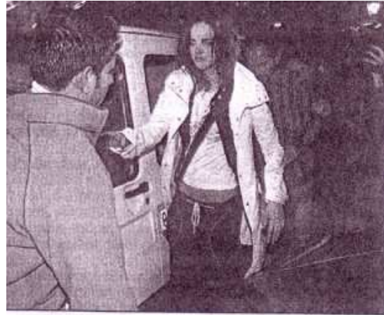
Ayakta zor durmakta zorlandı